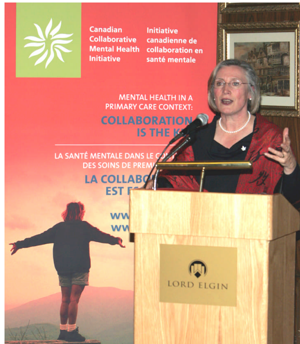
La ministre d'État fédérale à la Santé publique, Carolyn Bennett, s'adressant aux invités lors de la réception qui a marqué le lancement de l'Initiative canadienne de collaboration en santé mentale.

Au programme de la soirée : une visite du site Web de l'ICCSM lancé un peu plus tôt au cours de la journée. Ce site offrira un moyen de communiquer l'information sur le concept des soins partagés et sur son évolution vers un modèle de soins en collaboration.